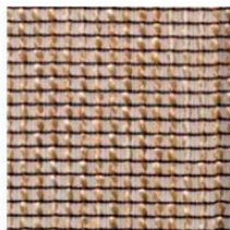
TS_24 Gold trevira wave Rete trevira oro

Абажуры трапециевидной формы из ткани Trevira (цвет на выбор из палитры фабрики), на фото TS_24. Ткань производства DEDAR, трудновоспламеня емая, удовлетворяет актуальным требованиям противопожарных нормативов